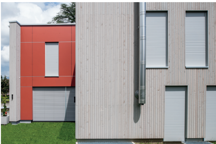
Privaten Wohnbauten verleiht Regapak® sowohl im geschlossenen Zustand als auch in den verschiedenen Gebrauchspositionen ein klares, modernes Erscheinungsbild.