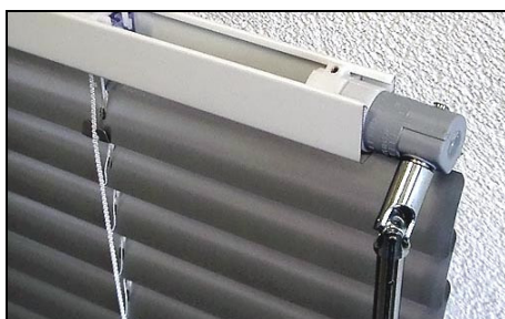
MF 25/35 HK – Variante B