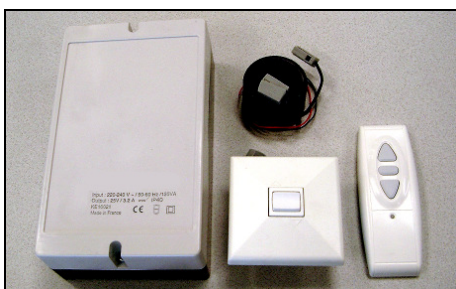
Automatisation, Schalter mit integriertem Trafo, etc