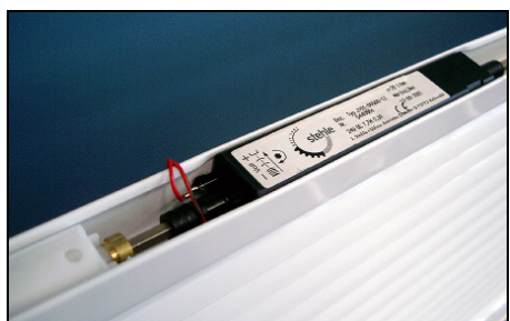
Neuer, kompakter Minimotor, 25x25 mm

Motorantrieb: Stehle-Minimotor, 24V. Auflaufpilz für obere Abschaltung. Untere Abschaltung mit integriertem Endschalter.