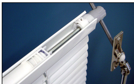
MF 25/35 HK – Variante C / DVK – Zw. Glas

Motorantrieb: Stehle-Minimotor, 24V. Auflaufpilz für obere Abschaltung. Untere Abschaltung mit integriertem Endschalter.