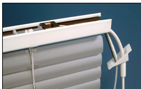
DVS 25/35 – Zwischenverglasung (flex. Welle)

Handkurbel: neu mit Stahlgetriebe Aufzug und Lamellenwendung mit Getriebe, Kreuzgelenk und Handkurbel. Typ MF/SF-HK: Variante A = Handkurbel senkrecht neben den Lamellen und Oberschiene 30 mm über die Lamellen vorstehend. Variante B = Getriebe bündig mit den Lamellen, seitlich nicht vorstehend. Typ DVK: mit Kreuzgelenk, Abdeckplatte und Sechskant für Fensterrahmendurchbruch (Montage zwischen zwei Scheiben).