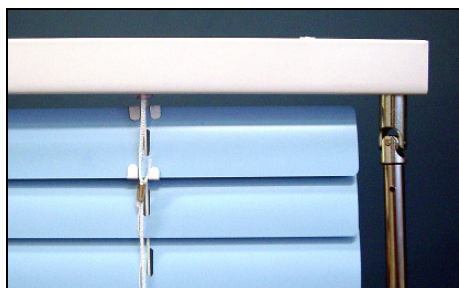
MF 25/35 HK – Variante A

Handkurbel: neu mit Stahlgetriebe Aufzug und Lamellenwendung mit Getriebe, Kreuzgelenk und Handkurbel. Typ MF/SF-HK: Variante A = Handkurbel senkrecht neben den Lamellen und Oberschiene 30 mm über die Lamellen vorstehend. Variante B = Getriebe bündig mit den Lamellen, seitlich nicht vorstehend. Typ DVK: mit Kreuzgelenk, Abdeckplatte und Sechskant für Fensterrahmendurchbruch (Montage zwischen zwei Scheiben).