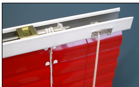
MF 25/35 – Ausführung N (Schnur R, Stab L)

Schnurzug: Aufzug und Lamellenverstellung mit Zugschnur, Schnurschloss und Wendestab. Bei Standardausführung der Typen MF 25/35 und SF 25/35 ist das Schnurschloss rechts, der Wendestab links. Andere Varianten siehe Katalog, Rückseite des Bestellformulars. DV-Typ mit flexibler Welle, Durchführungsspirale für Schnur, inkl. Drehstab starr oder flexibel.