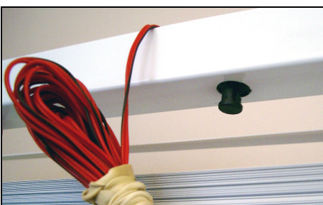
Kleiner, sensibler Abschaltpilz, 2,5 m Kabel